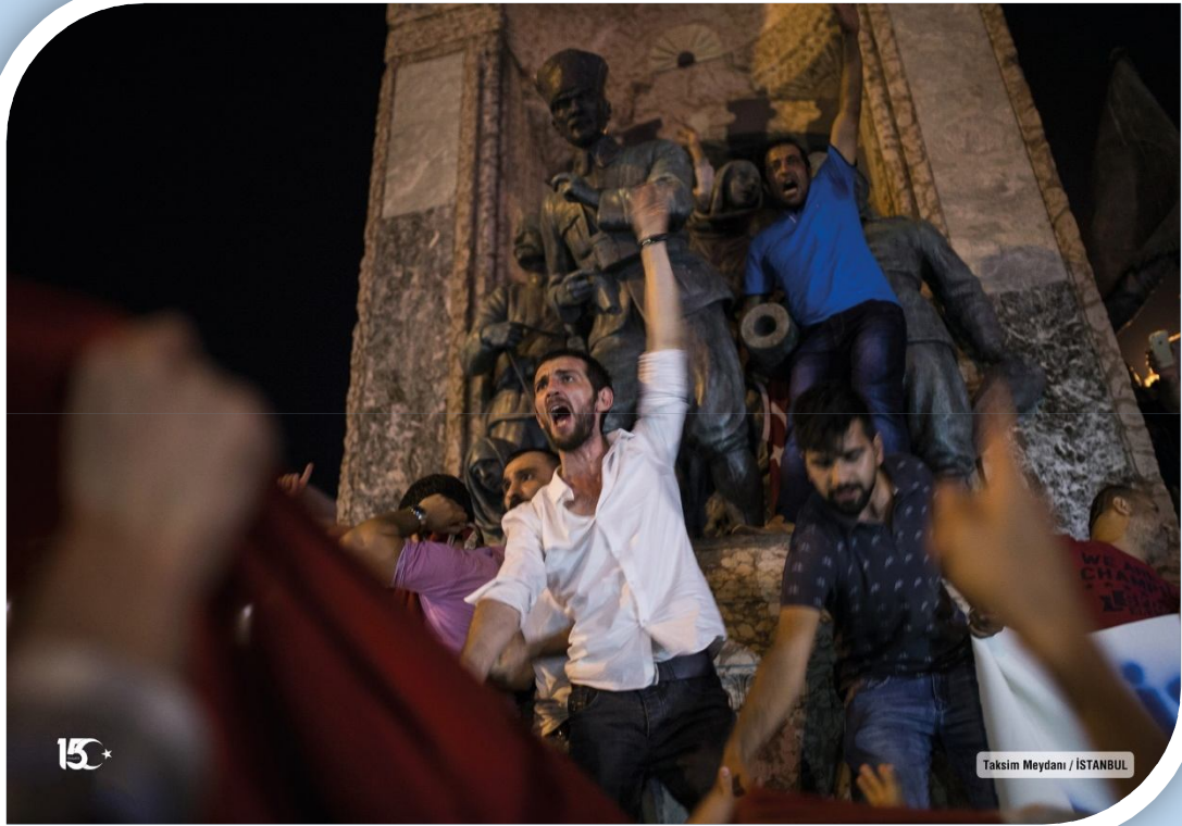
Taksim Meydanı / İSTANBUL