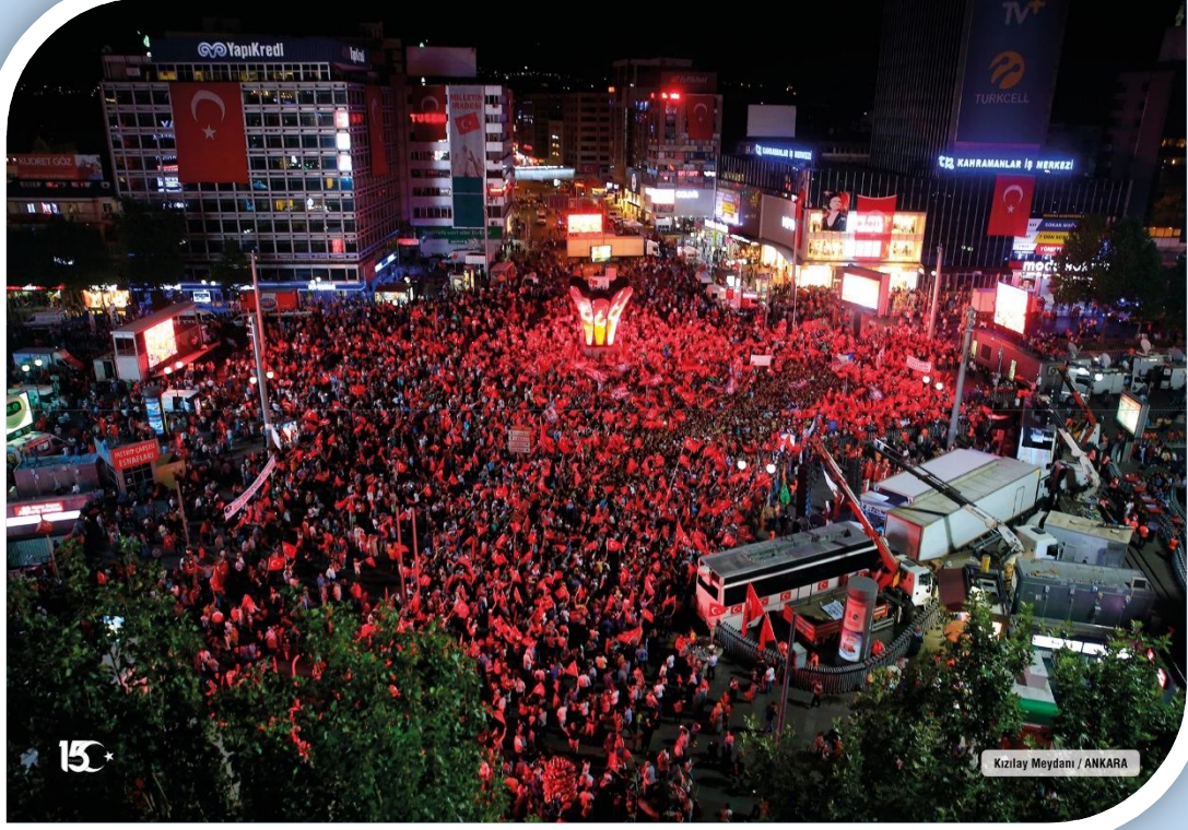
Kızılay Meydanı / ANKARA